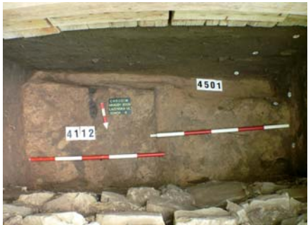
ARCHEOLOGOVĚ objevili v Lázeňské ulici i pozůstatky pravěkého opevnění.

V současnosti je archeologický průzkum v Lázeňské ulici skončen a zpracovává se k němu dokumentace. „Přinesl nám dva zásadní poznatky - překvapivou existenci pravěkého opevnění a zachování středověké hrady v těchto místech,“ uzavírá archeolog. ROMAN ZAHRADKA