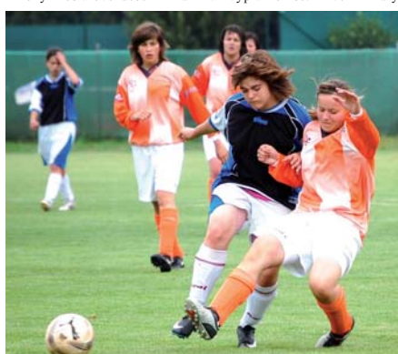
Utkání Pardubice - Jihlava.

ujala střela Hamerníkové ze 40 metrů, která si našla své místo pod břevnem domácí branky. Utkání mnohých dalších šancí nepřineslo. ST. ČÍVICE: Vaňurová – Kopečná, Hamerníková, Urbancová, Musilková – Voženilková, Holmanová, Knappeová, Kandrová – Svobodová, Fajmanová (Křemenová). Liberec B – Starý Mateřov 1:1 (1:0). A. Kročová. Domácí hráčky se ujal vedení z dorážky, na kterou gólmanka Sálavá po předchozím zákroku nedohleda. Hostující hráčky však bojovaly až do konce a vyplatilo se. Dvě minuty