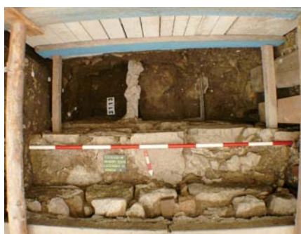
POHLED na zachovanou parkánovou hradbou v Lázeňské ulici v první polovině 15. století.

Chrudim - Narušená statika hradební zdi v Lázeňské ulici čp. 526 umožnila v těchto místech archeologický průzkum. Málo kdo ale v této souvislosti očekával nějaké překvapení. Přesto tu jedno na archeologie čekalo.