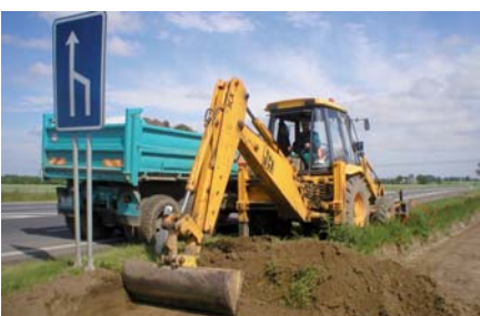
VZNIKAJÍCÍ cyklostezka z Chrudimi do Medlešic vyjde na sedm miliónů a dokončena bude v září.

Chrudim - Společnost Strabag zahájila v týdnu výstavbu prvního úseku cyklostezky z Chrudimi do Pardubic v délce 1900 metrů. Začíná u průmyslové zóny Sever na pravé straně vedle výpadyvky na Pardubice a odsud za značkou konec oběch přežít na levou stranu a končí v Medlešicích. Podle projektu bude široká tři metry, její povrch zivčivý a celý úsek osvětlen. Projekt počítá i s 54 listnatými stromy. Podle stavbyvedoucího Jaroslava Jiroška bude bezpečný přechod vyklíštěn přes hlavní silnici zajištěn omezením rychlosti vozidel, zpomalovacími pruhy a instalací zábrán, které donutí cyklisty sesednout z kola. (pav)