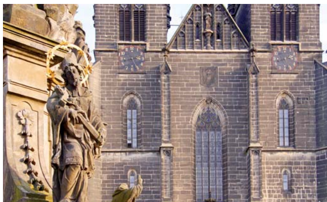
SLOUP Proměnění Páně je po kostele další dominantou náměstí.

Těto rady se nejspíš rozhodlo držet vedení radnice, které uvazuje, že nechá rozpusit v opravených vanách ve vodě modrou skalici, která přestane holubům