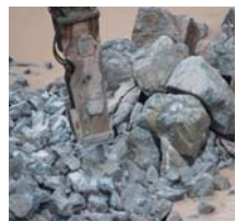
Drcení kamene je mravenčí praci hydraulického kladiva jsou větší kusy rubaniny mravenčí práci rozdrceny na drobnější, které se

snadněji naloží. Připravený materiál se odveze do celistvého drtíče, kde se podrtí na drobnou směs a na sítěch třídící rozseparuje podle požadované hrubosti drti a štěrku na jednotlivé velikostní frakce. To už je ten správný produkt na výstavbu a posyp silnic. Odstřel v lomech se řídí přísnými báňskými předpisy. Lom vlastní těžební společnost, která musí mít dobývací práva a po vyřízení, které může trvat i desítky let, musí dát krajinu do kulturované podoby. Firma, která má povolení k odstřelu, je vázána bezpečnostními předpisy a podléhá několikastupňové kontrole. Nadimenzovaná odstřel skalní stěny tak, aby rozpojil požadovaný horninový blok a nezpůsobil přitom žádné negativní účinky na okolí, je jejich každodenní prací. Takovou firmou je i Fospol a.s. Pardubice. Nespecializuje se jen na vrtné a hrací práce v kamenolomech. Potkat se s jejich prací můžete i při odstřelech komínů, které jsou pro ně velice prestižní záležitosti. Při nich mohou v plné kráse předvést to, co do-