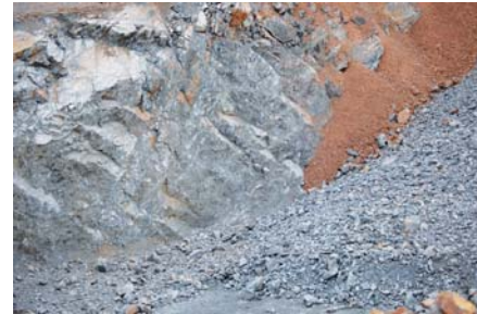
Vpravo část skály připravená na odstřel, vlevo část skály po odstřelu

jsou každoročně proškolení a procházejí přísnou kontrolou. Největší důraz klademe na odborníky, kteří umí pracovat s maximální přesností a pečlivostí. Samotné provedení odstřelu je tedy