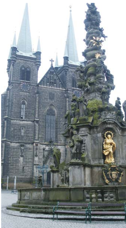
KOSTEL Nanebevzetí Panny Marie na Resselově náměstí čekají opravy a nové zabezpečení.

Kostel Nanebevzetí Panny Marie má být více přístupný lidem