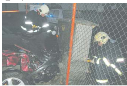
HASIČI průběžně do příjezdu plynářů kontrolovali, zda neuniká z uzavěru plynu.

Chrudim - Profesionální hasiči vyjžděli ve středu v 16.52 hodin k havárii dodávky a osobního auta. K jejich střetu došlo v ulici Obce Ležáků na výhledu z Chrudimi do Slatiňan. „Osobní vůz po nehodě narazil do hlavního uzavěru plynu. Hasiči proto nechal místo přivolat pracovníky plynárn. Do té doby prováděli měření koncentrace plynu detekčním přístrojem. Unik plynu ale nebyl naštěstí zjištěn,“ říká mluvčí hasičů Vendula Horáková. Hasiči podle ní odpojili autobaterie, aby nedošlo k požáru vozidel, zabránili úniku jejich provozních náplní a odstranili auta ze silnice. (rz)