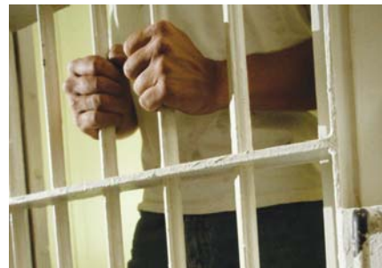
PODVANÁCTÉ do vězení.

Dotřetice byl ale už úspěšný, a to ve Slatiňanech, kde se vloupal do rodinného domu. Tady rovněž rozbil kamenem sklo u vchodových dveří, pro-