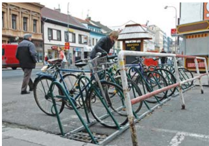
BEZPEČNOSTNÍ stojany nahradily podle náměstka Kolářky ty, které nechránily a překážely.

Nyní této možnosti využívají asi tisícovka lidí. „Tisíc dobře zabezpečených kol na padesáti různých místech mi nepřipadá na naše město málo. Proto mě nadzvedl názor místního novináře, který instalaci těchto stojanů označil za propadák. Víme, že stojany jsou většího využití tak, jak pro zabezpečení kola používány být mají, tedy se speciálním zámkem,“ uvádí ředitel městské policie Petr Kvaš. Policie šetří v Pardubicích ročně stovky případů krádeží kol. Proto se město v roce 2005 zapojilo do projektu „Vaše kolo v bezpečí“ a nechalo osadit nejfrekventovanější místa více než 120 bezpečnostními stojany pro téměř tisíc jízdních kol. Celý projekt přišel na více