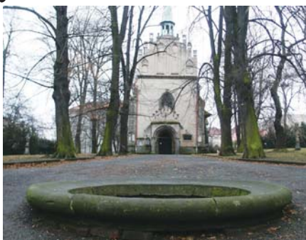
Z KAŠNY v Michaelském parku má zase tryskat voda a lidé přestanou brkat na rozbité cestě.

Zatímco Michaelský park projde ještě nezbytným schvalovacími řízeními, o rekonstrukci arciděkánského kostela Nanebevzetí Panny Marie je už rozhodnuto. Začne se letos opravou krovů a střechy krytí. Odhaduje se, že tyto práce vyjdou asi na osm milionů z celkové investice 49 milionů korun, které budou rozlo-