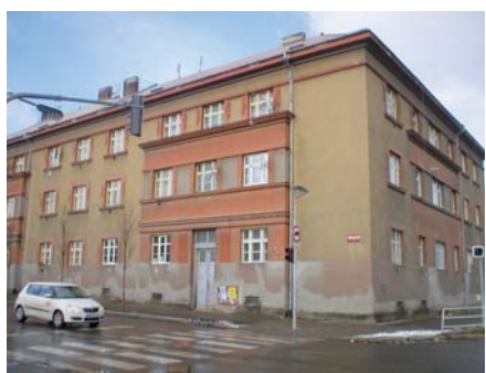
ZDE vznikne 12 startovacích bytů.

Koncept návrhu územního plánu odmítá expanzi města