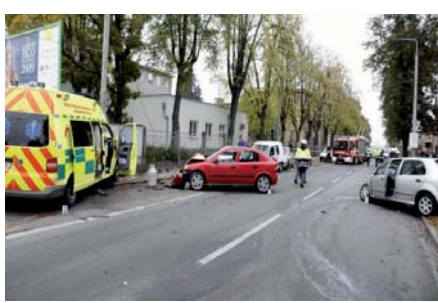
PŘI HAVÁRII byl poškozen sloup trolejového vedení, šest aut a optický kabel, vznikla škoda za 450 tisíc.

Pardubice - Ve čtvrtek kolem 15. hodiny havarovalo před krajskou nemocnicí šest aut a zhruba na dvě hodiny naprosto znepříjemnilo Kyjevskou ulici. Sanita VW Transporter, jedoucí po hlavní silnici se zapnutými výstražnými světly a houkačkou k naléhavému případu, se tu střetla se Škodou Fabii 51leté řidičky, vjíždějící na hlavní komunikaci. Sanita byla nárazem odhazena na sloup trolejového vedení, který poškodila. Následně ještě narazila do zaparkovaného vozu Opel Astra, který spustil dominový efekt - vrazil do Peugeotu Partner a ten zase do Fordu Mondeo. Při nehodě byla zraněna řidička fabie. (rz)