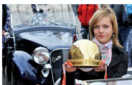
OVZROČNĚNÝ TROFEJ zlaté přílby je mezi plochodrážníky každoročně mimořádně velký zájem.