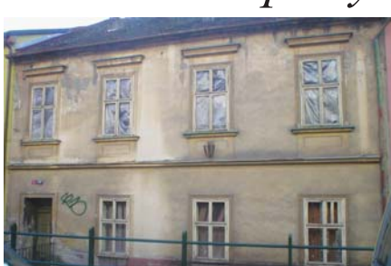
DŮM čp. 156 hzdí v Chrudimi Soukenické ulici. Město ho chce proto okamžitě zpátky.