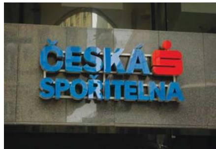
TERČEM útoku byla Česká spořitelna.

Kriminalisté se v současnosti zabývají otázkou, zda je mezi oběma loupežemi, tu pon-