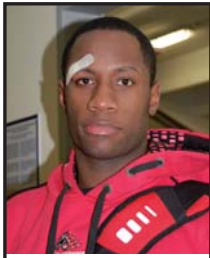
LEVELLSANDERS pozápase s Novým Jičínem odchází z kabiny s několika stehy na čele.

Pardubice – Další dvě porážky si v minulém týdnu na své konto v Mattoni připsali basketbalisté BK Synthesia Pardubice. Zatímco ta středeční s Libercem (78:89) patří do kategorie ostudných a měla dohru ve finančním postihu hráčů, sobotní s Novým Jičínem lze označit jako velmi nešťastnou. Jakoby se v této sezóně proti pardubickému mužstvu vše spinkulo. Po různých zdravotních trablech zadržovali tentokrát i sudí, kteří pardubický tým doslova „zaržili“. Hráči mají do soboty čas vyčistit hlavy a důkladně se připravit na utkání s USK Praha, které se hraje v CEZ Areně od 17 hodin. Rozhodovat ho mají Zachara, Vondráček a Kitterlové. Přijede-li Vondráček, určitě ho nebude čekat příjemné přivítání.