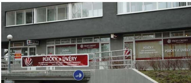
HNED DRUHÝ DEN po razii se v pardubické centrále společnosti Profi Credit v sídlišti Poseidon tvrdě pracovalo. Nic nenasvědčovalo tomu, že tu zasahovala policie.

Finančník: „Zárok byl nepřiměřený a nebyl k němu důvod“