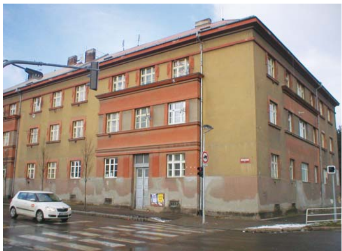
FIRMA Deltaplan zpracuje projekt přestavby domu čp. 490 v Rooseveltově ulici, který postavil stát za první republiky jako humanitární centrum pro sociálně slabé rodiny.

Ultramoderní zařízení vytvoří model rozsáhlé městské čtvrti