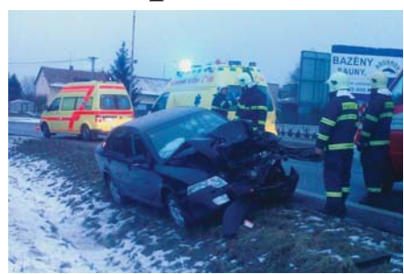
PO SRÁŽCE AUT v Markovicích hasiči odklízeli následky této havárie.

Chrudim/Markovice - V úterý zasahovali profesionální hasiči v 7.14 hodin v chrudimské místní části Markovice u dopravní nehody dvou automobilů. Dvařicetiletý šofér nákladního vozu Volkswagen Transporter se tady při předjíždění jiného nákladního auta čelně střetl se Škodou Octavii. Při havárii se zranil řidič škodovky, který musel být převezen do nemocnice, kde zůstal nakonec hospitalizován. Hmotná škoda se v tomto případě odhaduje na 200 tisíc korun. „Hasiči zabezpečili místo nehody proti požáru a úniku provozních náplní,“ uzavírá mluvčí hasičů Vendula Horáková. (rz)